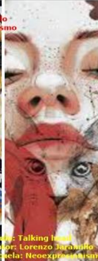
Título: Talking head Pintor: Lorenzo Jaramillo Escuela: Neoexpresionismo