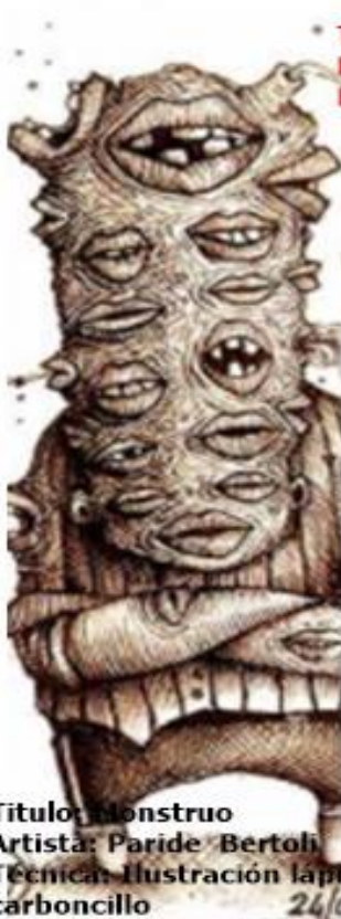
Título: Monstruo Artista: Paride Bertoli Técnica: Ilustración lápiz carboncillo