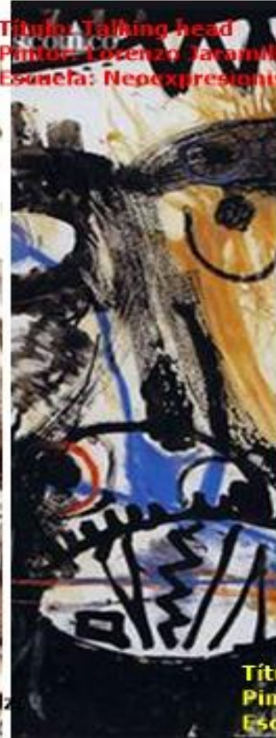
Título: Talking head Pintor: Lorenzo Jaramillo Escuela: Neoexpresionismo