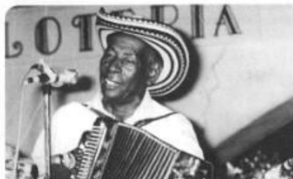
Alejandro Durán, acordeonero, compositor e intérprete del vallenato.