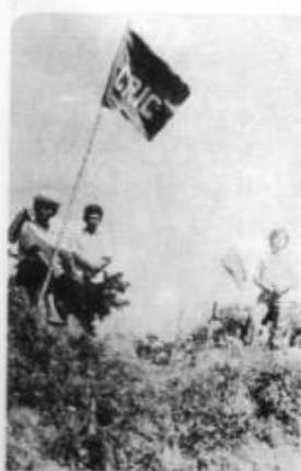
Indígenas con banderas del Consejo Regional Indígena del Cauca.