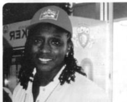
Maria Isabel Urrutia, medalla de oro en los Juegos Olímpicos de Sidney, 2000. Miembro de la Cámara de Representantes 2002-2010.